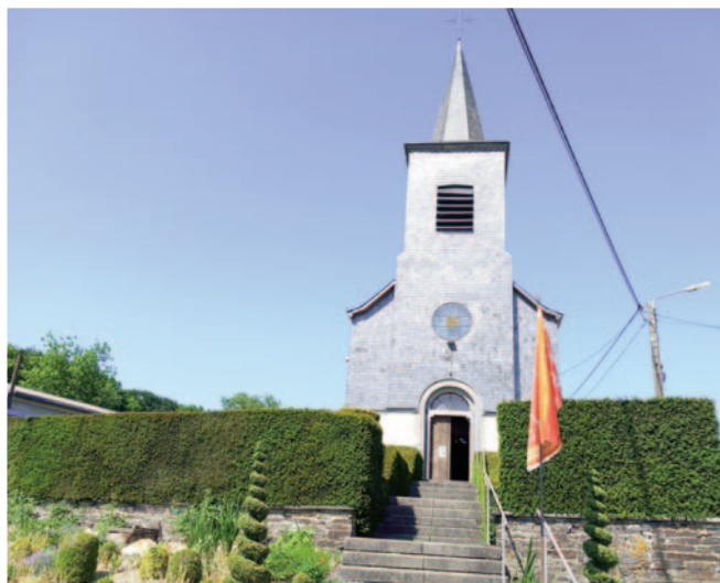
6640 Lescheret - Saint-Roch