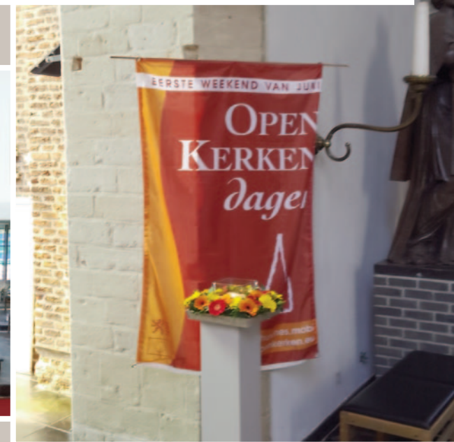
2540 Hove - Sint-Laurentius