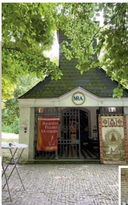
4051 Vaux-sous-Chèvremont Notre-Dame de Chèvremont