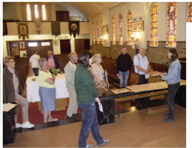
4601 Sarolay Notre-Dame de l'Assomption

Journées Églises ouvertes et visite commentée par les dames du musée.