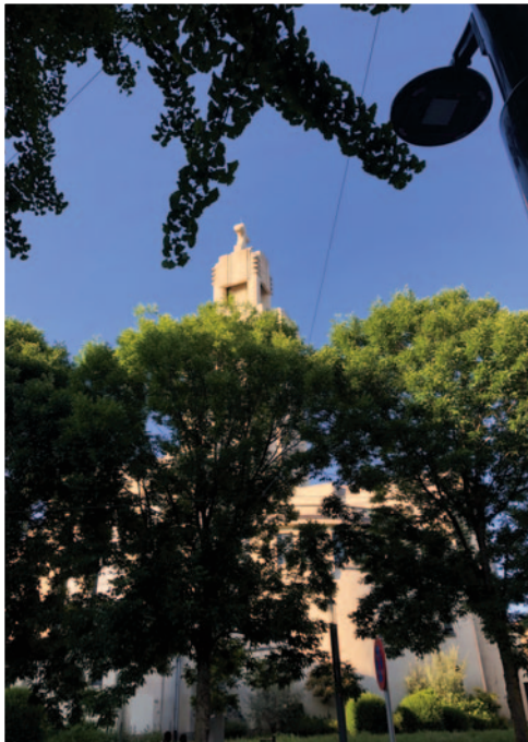
1190 Forest - Saint-Augustin