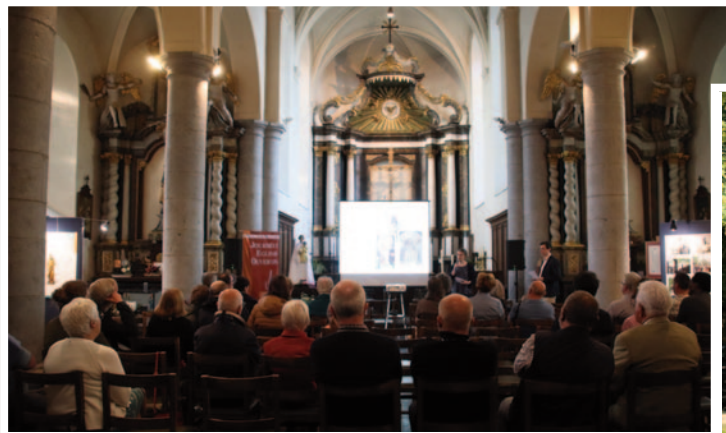
5650 Pry - Sainte-Remfroid