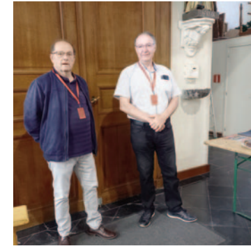
6280 Acoz - Saint-Martin