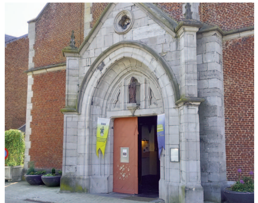
6280 Gougnies - Saint-Rémi