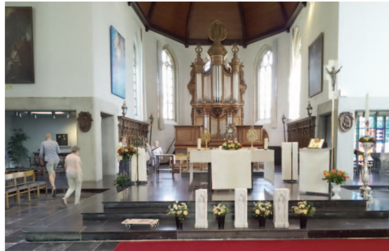
2880 Hingene - Sint-Stefaan