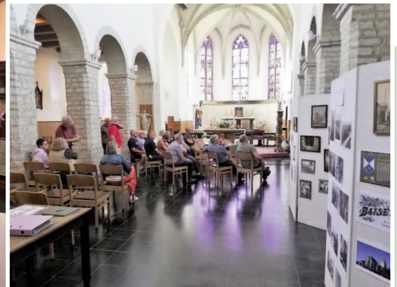
3300 Goetsenhoven - Sint-Laurentius