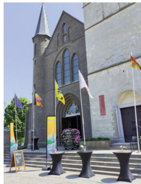
3640 Kessenich - Sint-Martinus