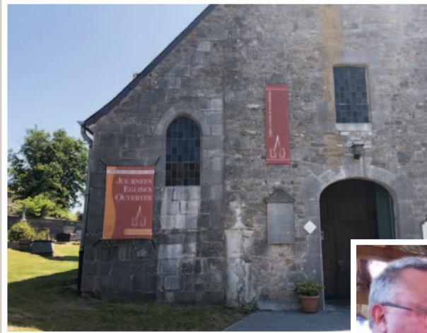
6440 Vergnies - Saint-Martin