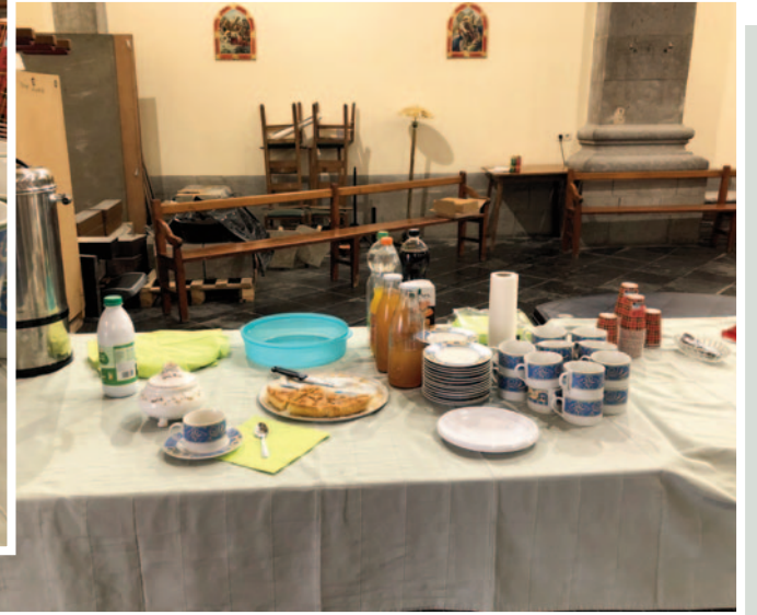
5660 Petigny - Saint-Victor