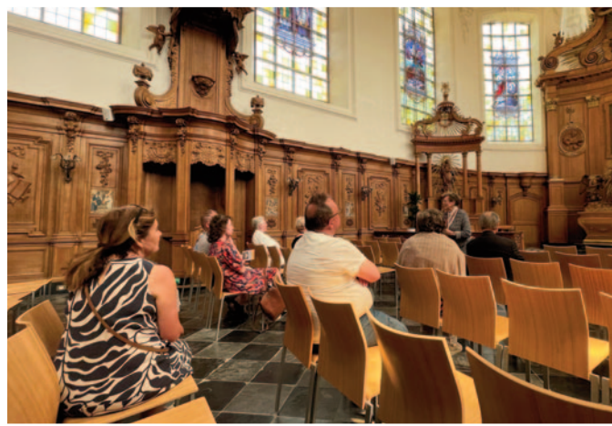
3320 Hoegaarden Sint-Rochus