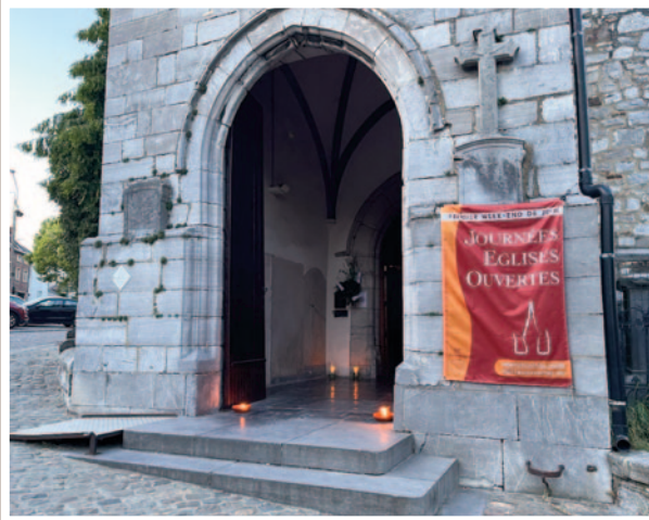
6110 Montigny-le-Tilleul - Saint-Martin