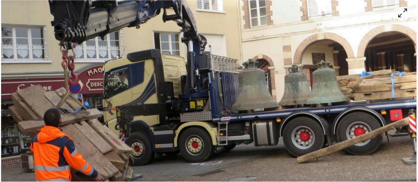
Judi matin, vers 8 h 30, grandes manoeuvres devant l'église.

Une grosse restauration est nécessaire sur la structure du XVIII e siècle, qui porte des cloches d'un poids total de plus de trois tonnes à l'église Saint-Martin de Longny-au-Perche (Orne).