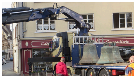
Les cloches vont être restaurées pendant trois mois.

Les cloches de l'église de Longny-au-Perche (Orne) vont être nettoyées, révisées, et un diagnostic complet va être réalisé.