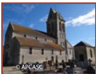
Creully-sur-Seulles Villiers-le-Sec église Saint-Laurent