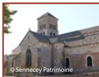
Sennecey-le-Grand église Saint-Julien (romane)