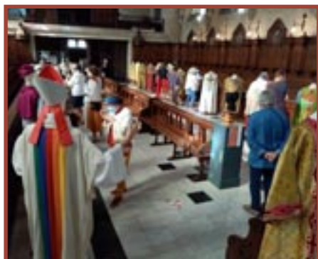
ARRAS, chapelle de la maison diocésaine (62) Lancement officiel dans le réseau et inauguration de l'exposition de vêtements liturgiques.