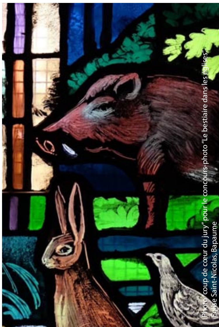
Photo 'coup de cœur du jury' pour le concours-photo "Le bestiaire dans les églises". Eglise Saint-Nicolas, Bapaume