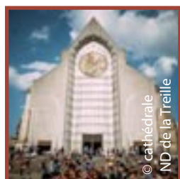
Lille cathédrale-basilique ND de la Treille et St-Pierre