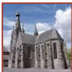
Solre-le-Château église Saint-Pierre