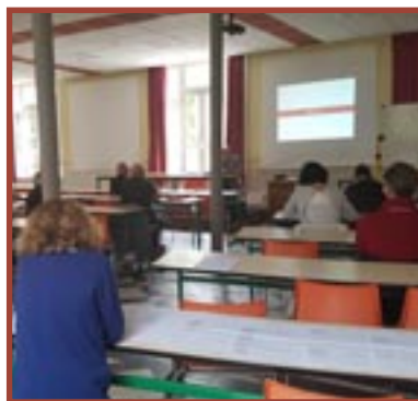
ARRAS, (62) Assemblée Générale de l'association Églises Ouvertes Nord de France