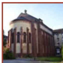
Arras chapelle de la maison Saint-Vaast