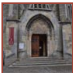
Arras église Notre-Dame de Bonne-Nouvelle