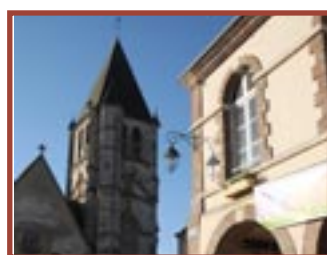
Longny-au-Perche église Saint-Martin