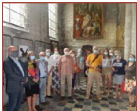
LILLERS, collégiale Saint-Omer (62) Remise des prix pour le concours-photo "Le bestiaire dans les églises" et inauguration de l'exposition sur le même thème.

durant les Journées Européennes du Patrimoine