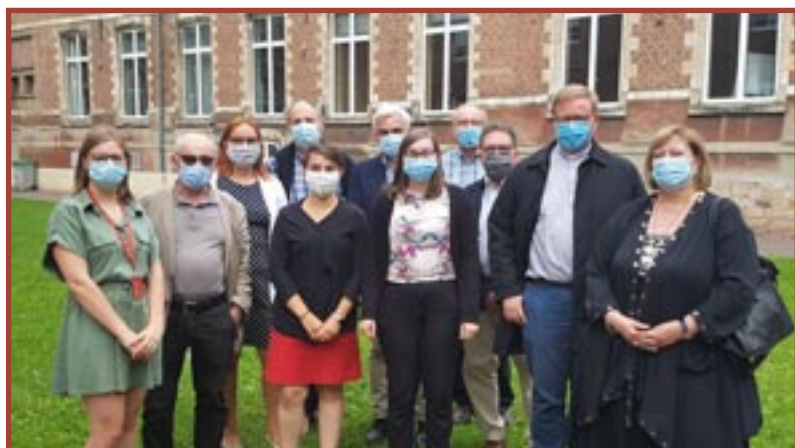
ARRAS (62) Jury pour le concours-photo "Le bestiaire dans les églises" sous la présidence de Benoît de Sagazan