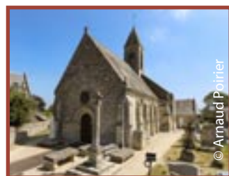
Creully-sur-Seulles Saint-Gabriel-Brécy église Saint-Thomas