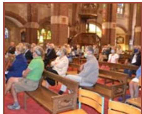
BAPAUME, église Saint-Nicolas (62) Inauguration de la nouvelle exposition d'Églises Ouvertes Nord de France sur la Via Francigena.