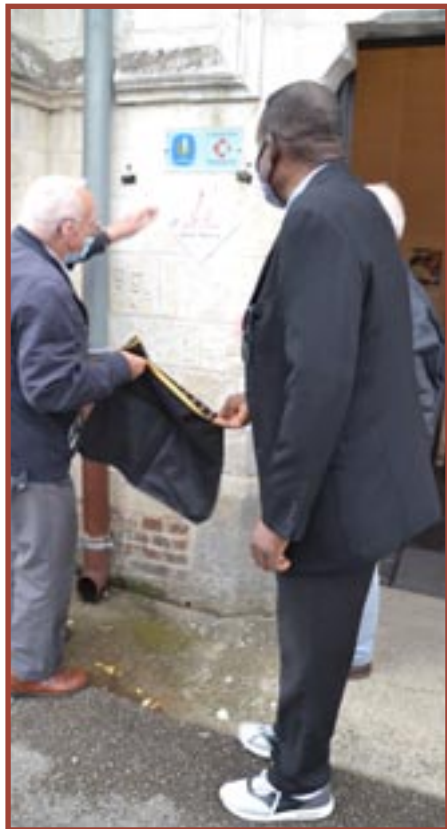
THÉROUANNE, église Saint-Martin (62) Lancement officiel dans le réseau d'églises ouvertes et accueillantes