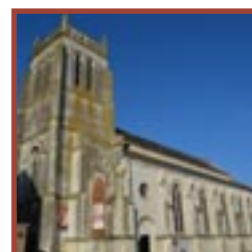
Thérouanne église Saint-Martin