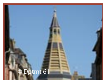
Domfront église Saint-Julien