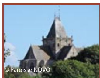
Écouché-les-Vallées église Notre-Dame