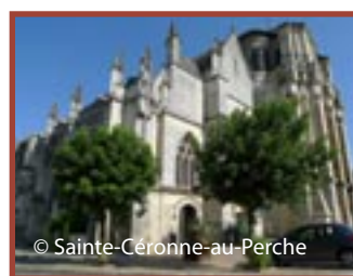
Mortagne-au-Perche église Notre-Dame