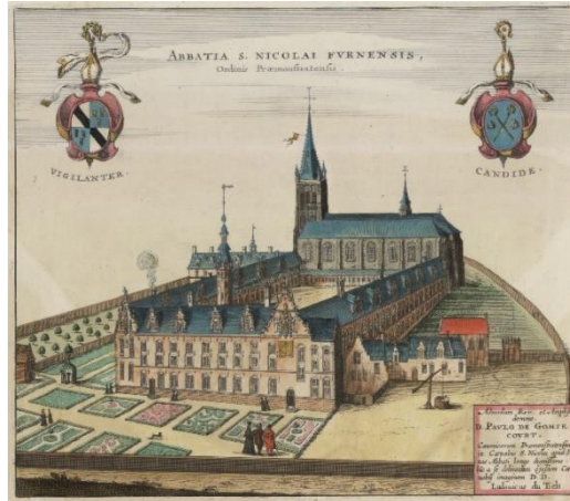
Kerkfabriek Sint-Niklaas Boterweegschalstraat 5, 8630 Veurne

Die Sankt Niklaus Abtei Veurne in der ersten Hälfte des 17. Jahrhunderts (Bild aus Flandria Illustrata - 1641)