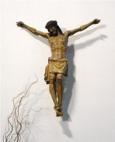
Au début des années septante, le chœur de l'église a été modifié à la suite du concile Vatican II. Dans un esprit de dépouillement, seul un Christ sans croix orne le mur blanc du chœur.