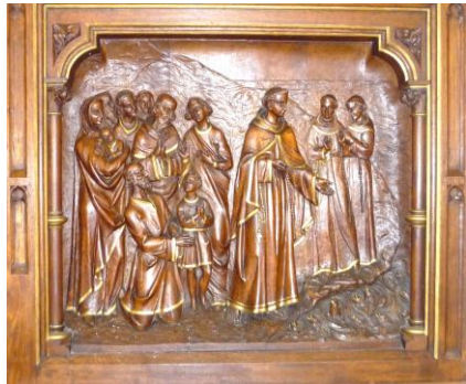
A gauche, la statue de Notre Dame de Lourdes est entourée de 2 retables illustrant les apparitions et miracles.