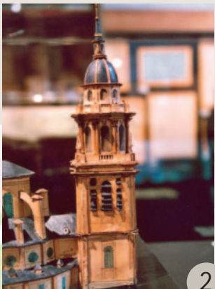
Maquette, Trésor de la Cathédrale